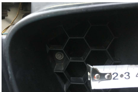
六角穴分寸法 (参考写真1)